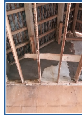
Rénovation de la charpente